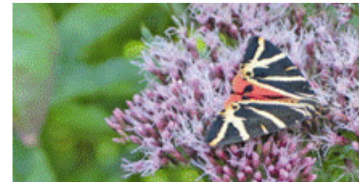
Landschaft und Ökologie